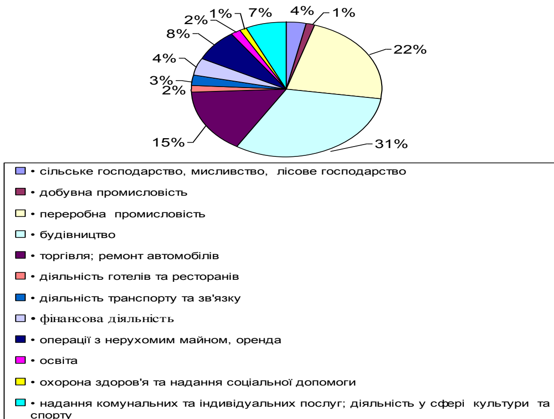
Рис. 3. Структура розподілу трудових іммігрантів в Україні за видами виконуваних робіт у 2008 р.

працевлаштовано 2764 осіб, або 22% іммігрантів. У сфері торгівлі та ремонту автомобілів задіяні 15% трудових мігрантів або 1910 осіб.