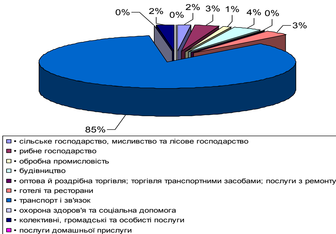
Рис. 2. Структура розподілу українських трудових мігрантів в країнах працевлаштування за видами виконуваних робіт у 2008 р.

Серед вибулих найбільша частка осіб працездатного віку, що свідчить переважно про трудову міграцію. Причому, частка чоловіків-мігрантів значно більша порівняно з мігрантами жіночої статі. Гендерні відмінності у структурі трудових мігрантів перш за все пов'язані з тим, що міграційна активність молодих жінок уповільнюється через народження та виховання дітей (рис. 3.).